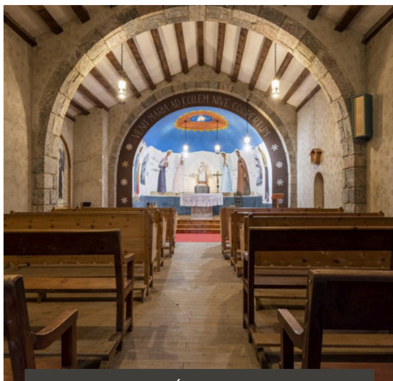
CAPELLA MARE DE DÉU DE LES NEUS, LA MOLINA