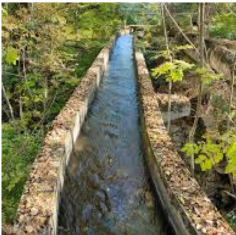
CAMÍ DE L'AIGUA - BOLVIR DE CERDANYA