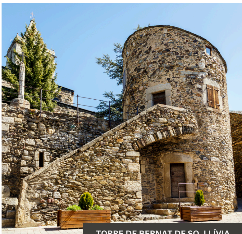
TORRE DE BERNAT DE SO, LLÍVIA